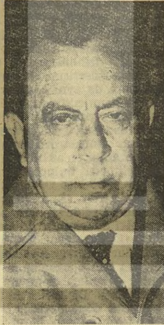
Dr. Fazıl Küçük

CIA'nın ilk elde merkeze gönderdiği raporlar gerçekten müthişti. Rumlar tarafından olmadık vahşet ve barbarlığa maruz kalan Türklerde en ufak bir yenilik duygusu yok-