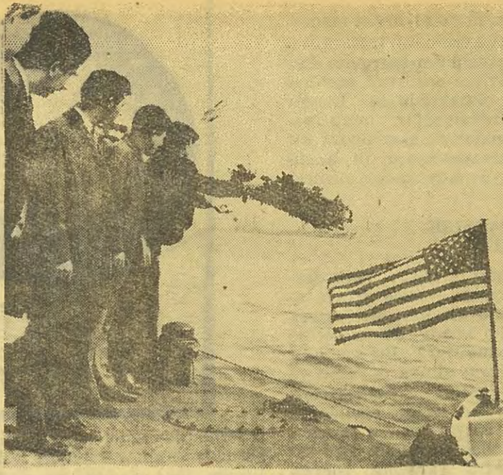
Dolmabahçe'de Altıncı Filoya çelenk atılıyor!... Akdenizde sarsılan itibar

kileri, kuvvet gösterisinden Amerikan vatandaşlarının tahliyesine ve hatta durumun gerektiği amfibi harekâta kadar uzanabilir. Yani Amiral, Akdeniz kıyısı ülkelerinde «Çıkarlarımız gerekirse, canımızın istediğini yaparız» demeye getirmektedir.