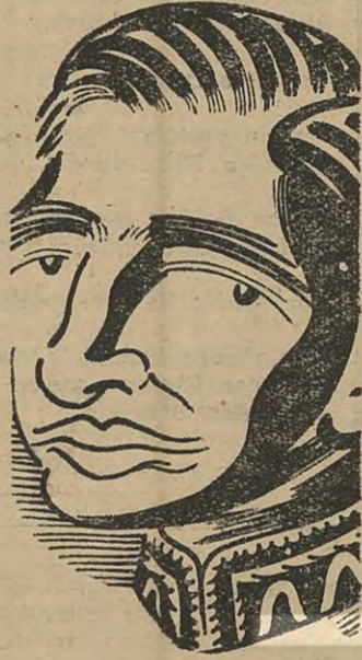
Kral Konstantin Demokrasi süsü...

Patakos'un durumunun sarıldığını ve iki istihbaratçı albayın yıldızının parladığını belirten Sulzberger, yazısını şu yorumla tamamlamaktadır: «Washington, triumviratının bir