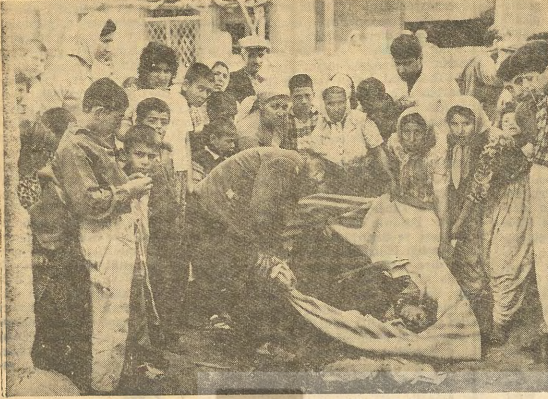
Adana Doğumevine alınmayanca sokakta doğuran kadın