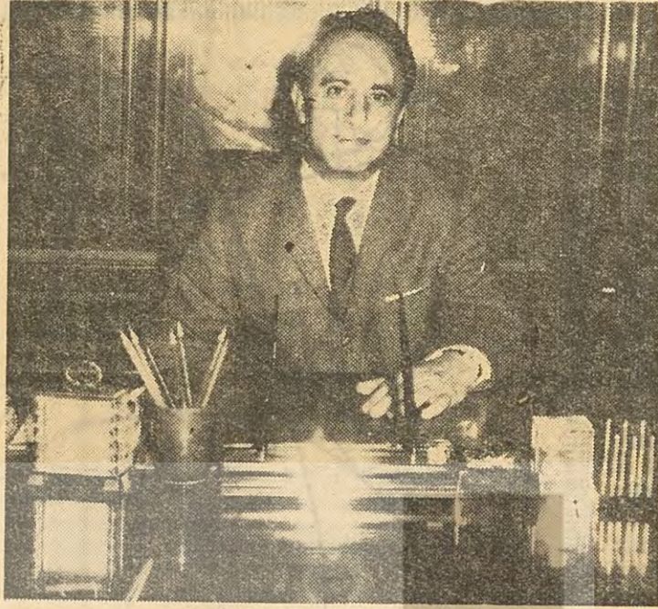
Maliye Bakanı Cihat Bilgehan İstifa mı, devalüasyon mu?

derde deva değildir. Devalüasyon, ciddi bir tedavi getirmeden, ekonomik güçlükleri belki de daha fazla arttıracaktır. Demirel tipi kalkınma politikası için ideal çare, büyük dostlarımızın dış ödeme açıklarını nutuklarındaki görülmemiş kalkınma edebiyatına uygun biçimde, cömertçe karşılamalarıdır. Ama geleceğin 400 milyon dolar kereste ihracından, müthiş turizm gelirinden nutuklarında bol keseden söz eden büyük dostlar, iş yardımı gelince, nutuklarındaki gibi cömert değillerdir. «Efendim özel yabancı sermayeyi cezbedin, ödeme açığımızı o hafifletsin» deyip yan çizmektedirler. Güçlük, bundan ileri gelmektedir. Demirel iktidarı, gerçekten zor bir durumdadır. Devalüasyona gitse de kötüdür, gitmese de kötüdür. Ne var ki, bütün bunlar, sıhhati büyük dostların himmetine dayandırılan bir ekonomik kal-