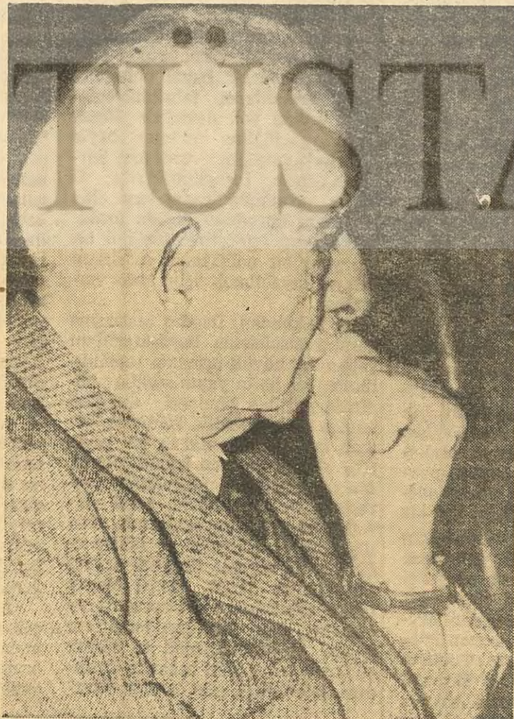
CHP Genel Başkanı İnönü «Anlayana saz...»

Demirel'e eski demokratların yönelttikleri bu hücumlar, herhalde Bayar'ın tasvibiyle yapılmaktadır. Eski demokratlar, nezuher «mirasçıyı» hazmedemekte ve mirasçının kendilerine yol açmasını istemektelerdir. Demirel ise, politika sahnesine, can sıkıcı ve tehlikeli rakipler çıkartmayı hiç mi hiç niyeli değildir. «Büyük müşavirler» de, bir eski demokratlar mezesi çıkarılarak, huzursuzluk yaratılmasına kesinlikle karşıdılar. Eski demokratların kendilerinde büyük kuvvetler vehmetselerine rağmen, Demirel'in durumu şimdilik kuvvetlidir. Mütteliklerimiz, Men-